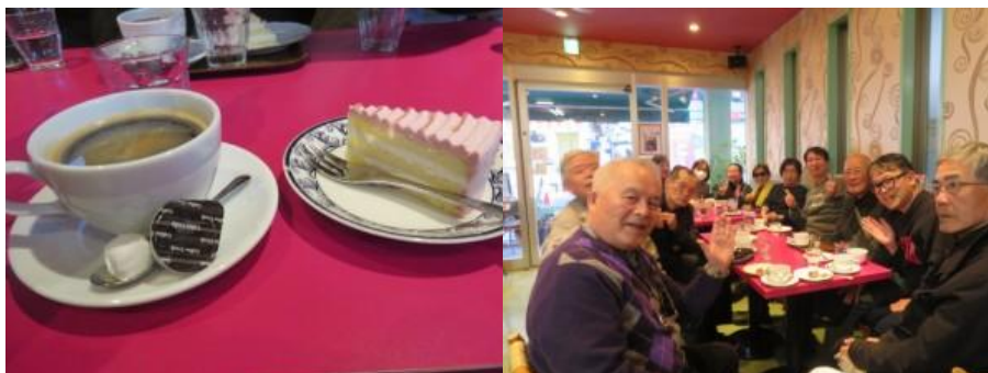
④二次会（喫茶店、12名参加） 15時～15時50分